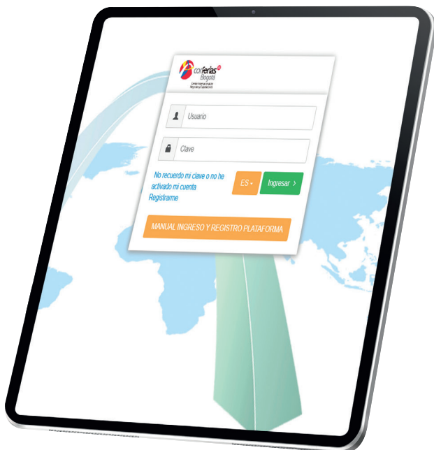
Ilustración 3. Vista previa principal del login Extranet Corferias.